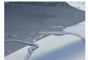
Beständigkeit gegen Wasser und Chemikalien